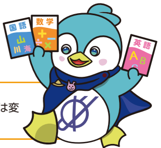
大阪国際高等学校 マスコットキャラクター グロバーリーミガク

GOOD NEWS 2024年度からはより受験しやすくなった幼児保育進学コース!!