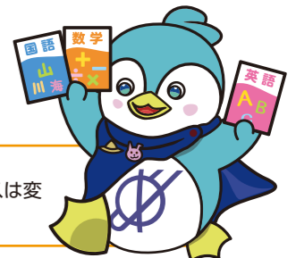
大阪国際高等学校 マスコットキャラクター グロバーリーミガク

GOOD NEWS 2024年度からはより受験しやすくなった幼児保育進学コース!!