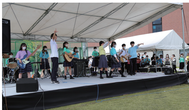
文化祭では様々なバンドが熱いステージを披露。観客も大盛り上がり!!